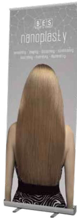
NANOPLASTY BANNER ROLL-UP 80 cm x h 200 cm ART. 27182 - LONG SLOGAN ART. 27183 - SHORT SLOGAN