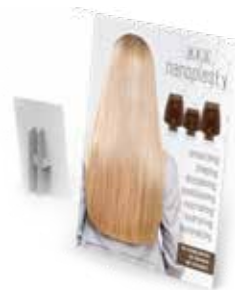
NANOPLASTY DESK DISPLAY 21 cm x 9 cm x h 30 cm ART. 47193