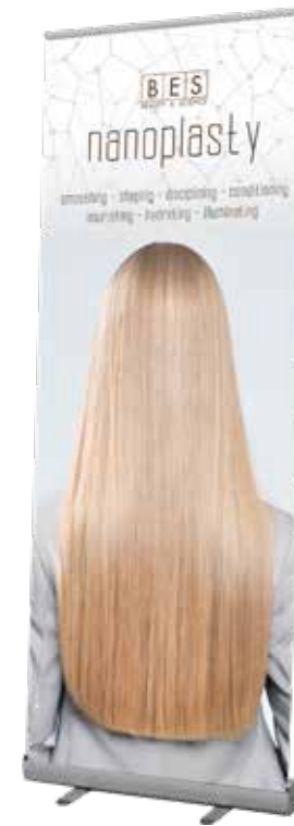
NANOPLASTY BANNER ROLL-UP 80 cm x h 200 cm ART. 47198