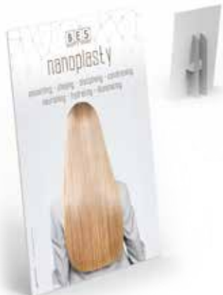
NANOPLASTY GROUND DISPLAY 70 cm x 35 cm x h 100 cm ART. 47184