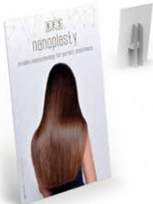
NANOPLASTY GROUND DISPLAY 70 cm x 35 cm x h 100 cm ART. 47185