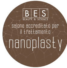
NANOPLASTY WINDOW STICKER 15 cm x 15 cm ART. 47194 - IT ART. 47195 - EN