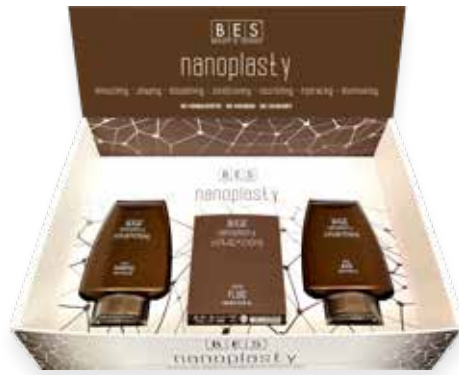
NANOPLASTY DISPLAY BOX WITH PRODUCTS 36 cm x 25 cm x h 9 cm (closed) - ART. 34028 EACH KIT CONTAINS 1 PC. NANO SHAMPOO 250 ml - NANO FLUID 150 ml - NANO MASK 250 ml