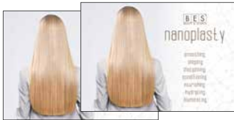
NANOPLASTY SALON FOLDER 30 cm x h 21 cm ART. 47196 - IT - EN - FR - ES ART. 47197 - NL - CS - HU - RO