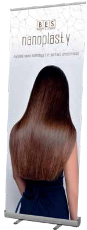
NANOPLASTY BANNER ROLL-UP 80 cm x h 200 cm ART. 47199